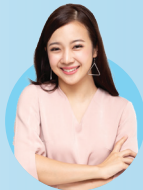
Sarah 30 Tahun

Diskon Premi untuk Tahun Pertama sebesar 5%, total Premi tahun pertama yang perlu dibayarkan (karena ikut Vitality Program): Rp 16.964.000 (Premi Dasar yang sudah didiskon) + Rp508.539 = Rp17.472.539 (Premi belum termasuk biaya keanggotaan Vitality Program)