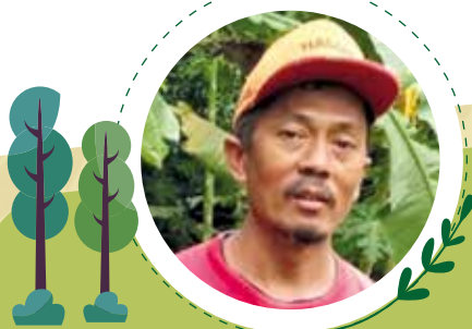
Tasrip Petani Jahe

Portofolio penyaluran KUR hingga akhir Desember 2020 sebesar Rp132,7 miliar, dengan 1.106 jumlah debitur. Angka ini meningkat 5,6% dibandingkan tahun 2019. Strategi penyaluran KUR dilakukan melalui cabang BCA yang tersebar di seluruh Indonesia. Selain itu, BCA juga melakukan kerja sama dengan skema offtaker dan channeling . Penyaluran KUR pada tahun ini didominasi oleh sektor usaha produksi. Selama tahun 2020, nilai NPL KUR BCA adalah sebesar 2,7%, nilai ini masih di bawah target 3%. [FN-CB-240a.2]