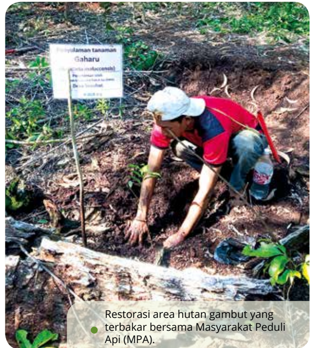
Restorasi area hutan gambut yang terbakar bersama Masyarakat Peduli Api (MPA).

Lebih dari 200 agent of change yang merupakan pekerja BCA dari 100 kantor/unit kerja di seluruh Indonesia.